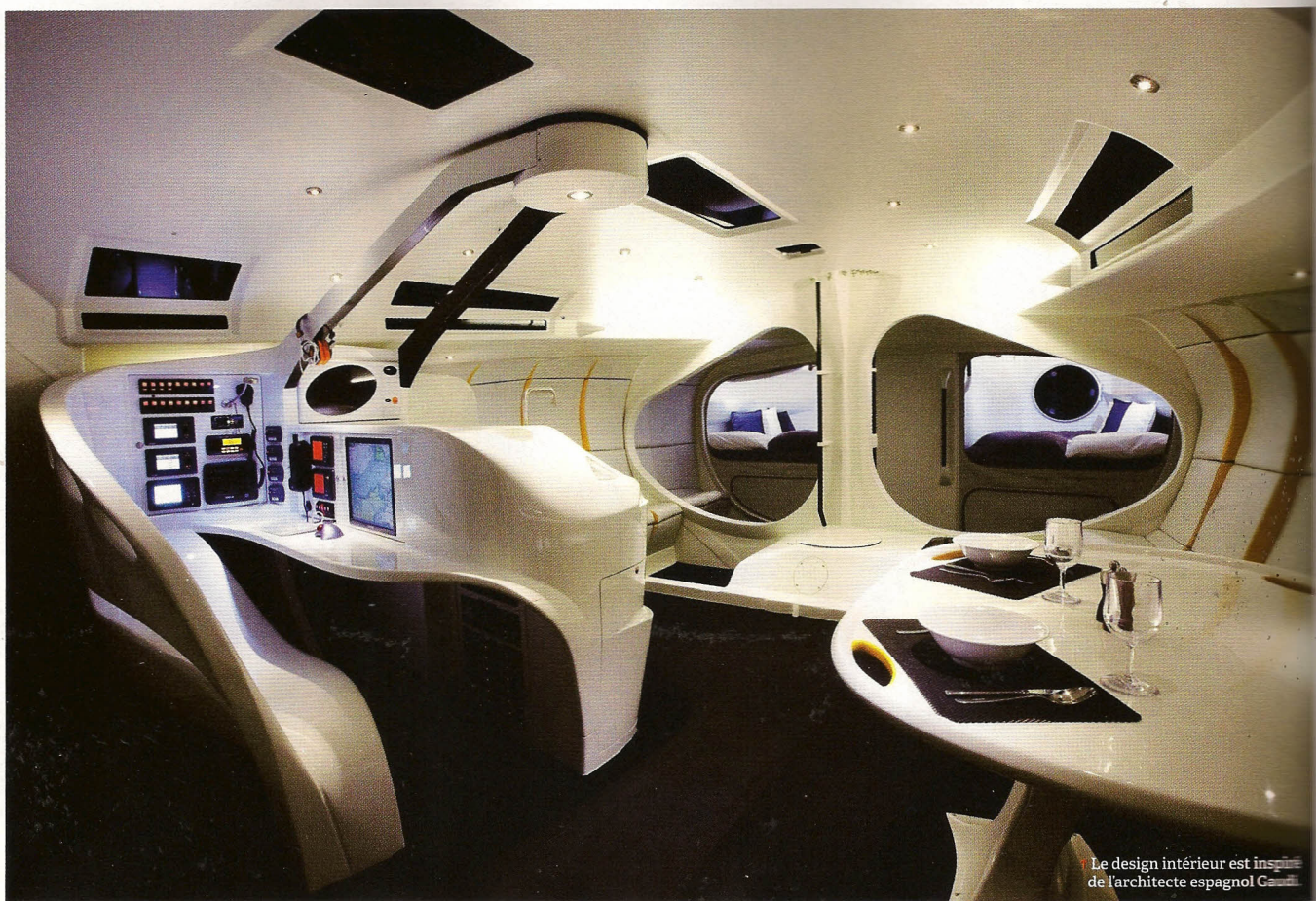
Le design intérieur est inspiré de l'architecte espagnol Gaudí.